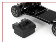
Leicht herausnehmbarer Akku