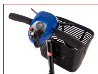
Weiche Griffe und doppelte Bedienelemente