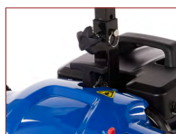
T-Bar-Griff mit Schnellverschluss